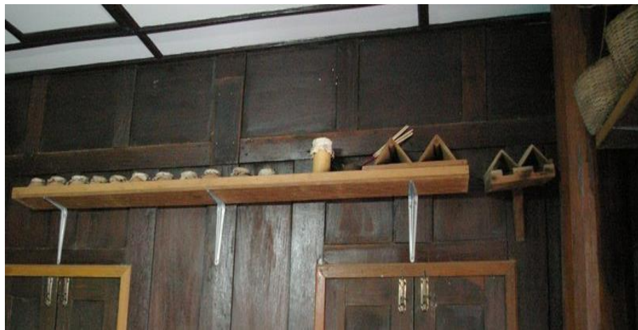
หม้อยาย กระจบอกยาย บ้านยาย และตะกร้ายายบนหิ้งในห้องนอนชาวชุมชนบ้านหนองขาว

นอกจากนี้ยังมีหม้อ ๒ ใบวางคู่กันเรียกว่า “ยายตา” การเซ่นไหว้ประจำปีจะทำเช่นเดียวกับ ยายในหม้อ ในวันเซ่นไหว้ยาย หากเป็น “ยายพระ” หมายถึงพ่อครูฤๅษีที่เป็นพ่อครูของสิ่งศักดิ์สิทธิ์ทั้งหลายใน บ้านหนองขาว ปู่เขี้ยวเองก็ต้องเรียก “ยายพระ” ว่า “พ่อครู” ด้วย สิ่งของเซ่นไหว้นอกจากบายศรีปากชาม หมากพลู น้ำ และดอกไม้ธูปเทียนแล้ว จะต้องมีขนมเปียกปูนด้วย เมื่อเซ่นไหว้แล้ว ห้ามนำขนมเปียกปูนนั้นมา กินโดยเด็ดขาด จะต้องนำไปถวายพระทั้งหมด ในเวลาปกติ เมื่อมีการทำอาหารชนิดซึ่งเป็นที่โปรดปรานของ ยายก็ต้องแบ่งไปเซ่นไหว้บอกกล่าวและเรียกให้ยายกินก่อน เช่น ยายบางบ้านชอบกินแป้งจี๊ ทุกครั้งที่ทำ ขนมจิ้นก่อนจะบิ๊บเป็นเส้น ต้องแบ่งไปปิ้งเป็นแป้งจี๊ชิ้นเล็กๆ เซ่นไหว้ยายก่อนเสมอ ในกรณีที่หลงลืม การบิ๊บ เส้นขนมจิ้นในครั้งนั้นๆ มักจะออกมาไม่เป็นเส้น ยายบางบ้านชอบกินกระต่าย หากลูกหลานนำกระต่ายมาแกง กินในบ้านต้องให้ยายกินก่อน หากไม่แล้วลูกหลานอาจมีอันเป็นไปได้ เมื่อรู้ตัวแล้วต้องไปหากระต่ายมาแกงและ นำมาให้ยายกินเพื่อเป็นการไถโทษ ส่วนยายบางบ้านชอบกินเต่า คนบ้านหนองขาวรุ่นเก่าๆ เมื่อเห็นเต่าซึ่งรู้ว่า ยายชอบกินทั้งที่ไม่อยากฆ่าเต่าจึงมักจะพูดว่า “เต่าเนา เต่าเหม็น” และไล่เต่าไป แต่หากเจอแล้วเจออีกก็ๆ แสดงว่าเป็นความต้องการของยายก็ต้องนำเต่ามาฆ่าแกงให้ยายกินจนได้ ซึ่งความเชื่อเรื่องเต่าและการปฏิบัติ ต่อผีมอญที่ว่าด้วยเต่าก็เป็นแบบเดียวกับชาวบ้านหนองขาวทุกประการ