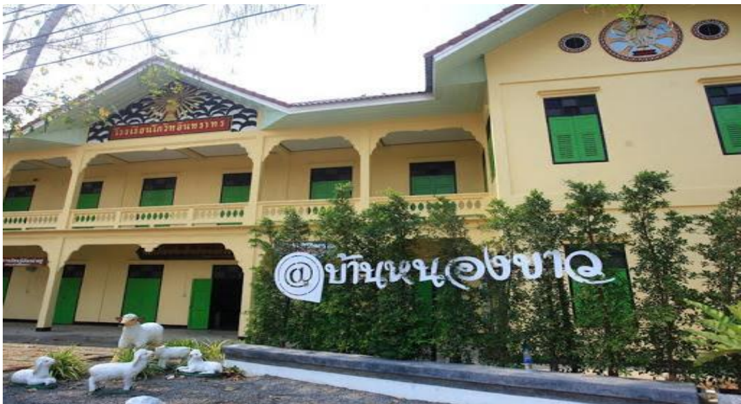
อาคารพิพิธภัณฑ์ในปัจจุบัน