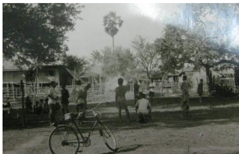
ภาพหมู่บ้านหนองขาวในอดีต

บ้านหนองขาวเป็นชุมชนขนาดใหญ่ กระทั่งมีคำกล่าวกันว่า “หมู่บ้านใหญ่ไถ่บิณไม่ตก” จึงเป็นที่ตั้งของสถานที่ราชการหลายแห่ง ได้แก่ สถานีโรงพยาบาลส่งเสริมสุขภาพ สถานีตำรวจ และโรงเรียนประถมขนาดใหญ่ มีถนนหลวงสายสุพรรณบุรี-กาญจนบุรี ตัดผ่าน เป็นเส้นทางเดินทางไปยังตัวเมืองกาญจนบุรีที่สำคัญคือบ้านหนองขาวมีวัฒนธรรมประเพณีท้องถิ่นที่น่าสนใจมากมาย เช่น การโกนจุก บวชนาค ทรงเจ้าแห่นางฟ้า สวดพระมาลัย การทำศพ การเล่นเพลงเหย่ย ซึ่งเป็นเพลงพื้นบ้านย่านนี้ และความเชื่อเรื่องหม้อตาหม้อยาย เป็นต้น