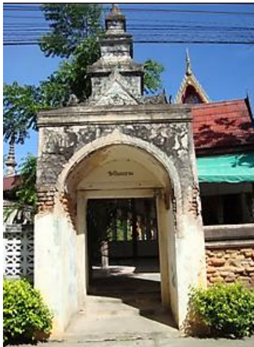
ประตูวัดเดิมยังคงความสวยงามอย่างมีเสน่ห์