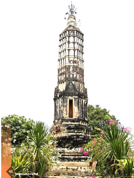
พระปรางค์ ศิลปะอยุธยา สร้างเมื่อ พ.ศ. ๒๓๖๕