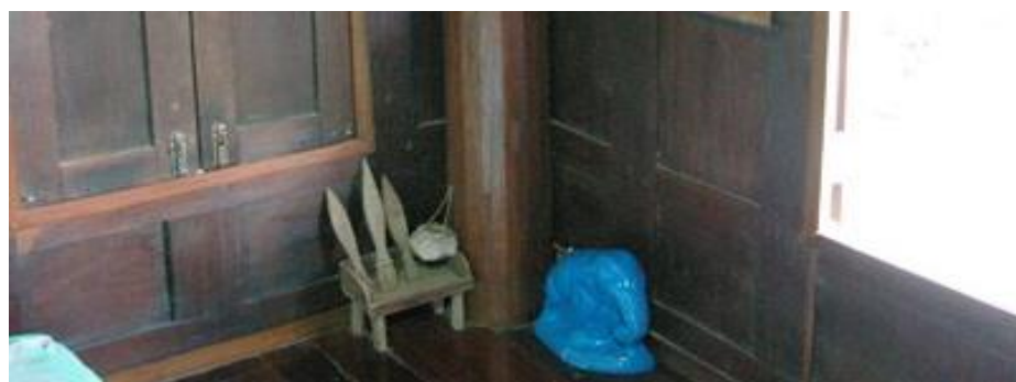
ไม้เจวีต