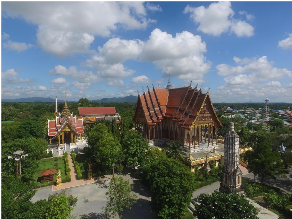
ภาพโบสถ์วัดอินทาราม

วัดอินทาราม ตั้งอยู่เลขที่ ๑ หมู่ที่ ๑ ตำบลหนองขาว อำเภอท่าม่วง จังหวัดกาญจนบุรี สังกัดคณะสงฆ์มหานิกาย ที่ดินตั้งวัดมีเนื้อที่ ๖๓ ไร่ ๒ งาน ๖๓ ตารางวา วัดอินทารามตั้งเมื่อวันที่ ๓๐ ธันวาคม พ.ศ. ๒๓๒๐ หลังจากหมดภัยสงครามระหว่างไทยกับพม่า จนทำให้เสียกรุงศรีอยุธยาครั้งที่ ๒ ให้กับพม่า เมื่อ พ.ศ. ๒๓๑๐ วัดอินทารามสร้างในสมัยสมเด็จพระเจ้าตากสินมหาราชครองกรุงธนบุรี แต่เดิมชาวบ้านเรียกกันว่า “วัดหนองขาว” วัดได้พัฒนามาอย่างต่อเนื่องจนถึงปัจจุบัน มีเรื่องเล่าขานจนเป็นตำนานของชาวบ้านหนองขาวว่าในรัชสมัยพระบาทสมเด็จพระจอมเกล้าเจ้าอยู่หัว รัชกาลที่ ๔ แห่งกรุงรัตนโกสินทร์ พระองค์ได้เสด็จพระราชดำเนินมาเมืองกาญจนบุรีเพื่อทรงนมัสการพระแท่นดงรัง และเสด็จมาประทับแรม ณ บ้านหนองขาว ต่อมาเมื่อวันที่ ๒๕ กุมภาพันธ์ พ.ศ. ๒๔๐๘ ชาวบ้านหนองขาวได้ร่วมกันบริจาคทรัพย์สร้างเสนาสนะเพิ่มเติม เพื่อใช้เป็นที่พักสงฆ์และใช้เป็นสถานที่ประกอบงานบุญตามประเพณีนิยมของชาวหนองขาว ช่วงระยะเวลาดังกล่าวทำให้วัดได้รับการพัฒนา มีความเจริญรุ่งเรืองมาก จนวัดหนองขาวกลายเป็นวัดประจำหมู่บ้านและได้เปลี่ยนชื่อเป็น “วัดอินทาราม” ซึ่งได้รับพระราชทานวิสุงคามสีมา เมื่อวันที่ ๓๐ สิงหาคม พ.ศ. ๒๕๒๐