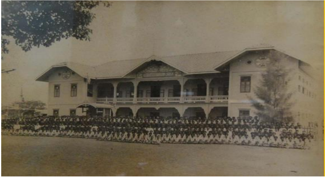
อาคารเรียนในอดีต โรงเรียนวัดอินทาราม “โกวิทอินทราท” ปัจจุบันได้ปรับปรุงเป็นพิพิธภัณฑ์