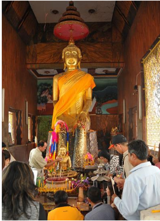
วิหารหลวงพ่อพระปางป่าเลไลยก์ ที่ชาวบ้านหนองขาวให้ความเคารพนับถืออย่างมาก และเป็นที่ ประจักษ์ของชาวบ้านหนองขาวถึงความศักดิ์สิทธิ์เป็นที่พึ่งยึดเหนี่ยวจิตใจมาแต่โบราณ