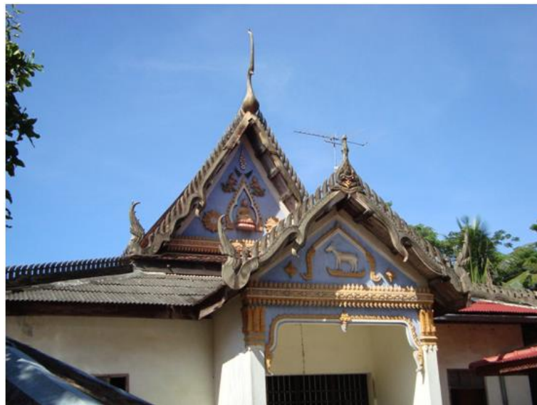
โรงธรรม หรือ ( หอสวดมนต์ )